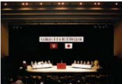
30周年記念式典（平成18年5月14日）

昭和52年に、県下初の軽費老人ホーム「尾鷲長寿園」をスバル地区に開園し、長茂会の高齢者福祉事業がスタートしました。ご利用の皆様を「自分の親として」というモットーのもと、サービス水準の向上へは果敢に挑戦し、よいと思ったことは何事も徹底してやり遂げようとする気風が出来上がりました。