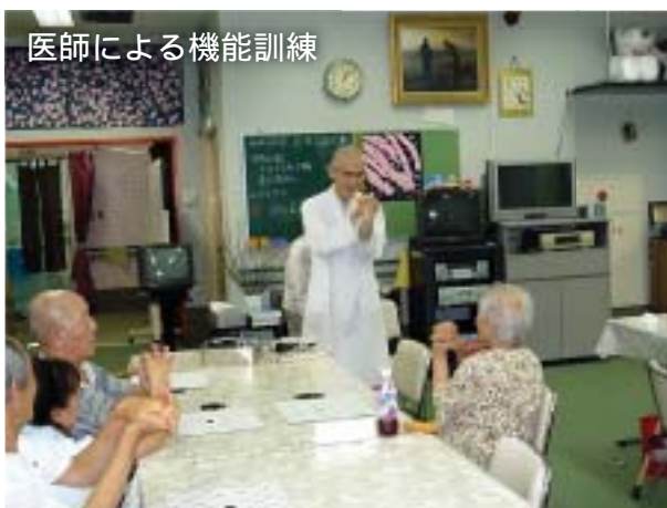
医師による機能訓練