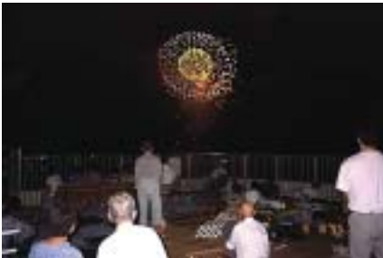
きらら屋上からの尾鷲花火（平成7年8月）