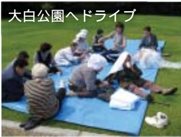
大白公園へドライブ

これからも、サービス水準の向上をめざしながら、地域の皆様との交流を深める開かれた施設運営を行い、ご利用者様やご家族の皆様への安心の提供を心がけます。