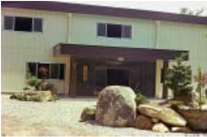
開園当時の尾鷲長寿園（昭和52年）