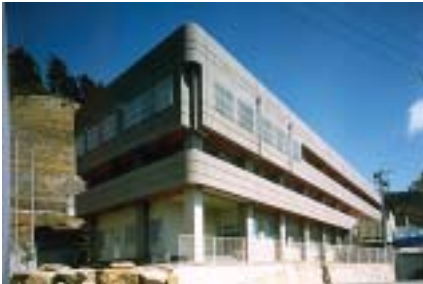
竣工時のスバル台（昭和63年）