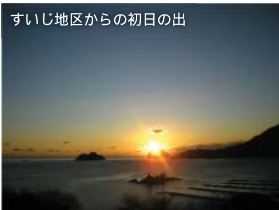
すいじ地区からの初日の出