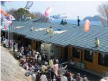
すいじ地区開園の餅まき（平成16年4月1日）