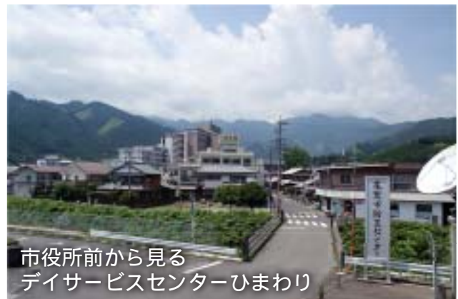
市役所前から見る デイサービスセンターひまわり