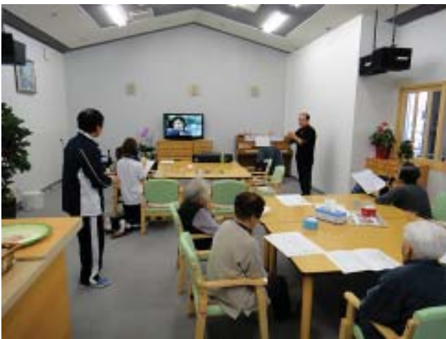
2011. 3. 20 麻雀