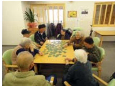
2011. 3. 14 坊主めぐり