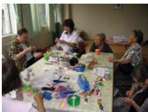
2010. 12. 25 クリスマス会