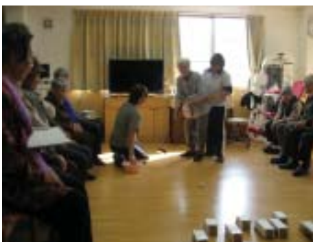
2011. 3. 14~19 銭形平次