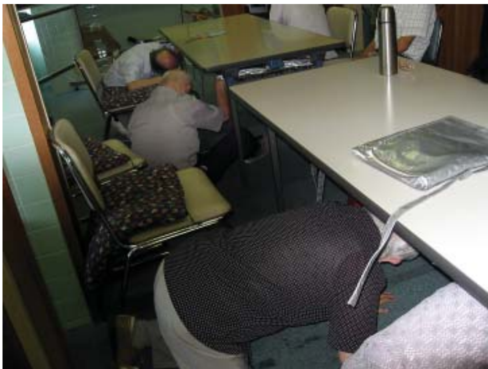
2010. 9. 10 防災訓練