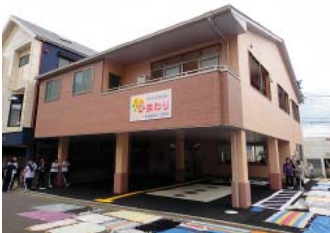
新築ひまわり地鎮祭