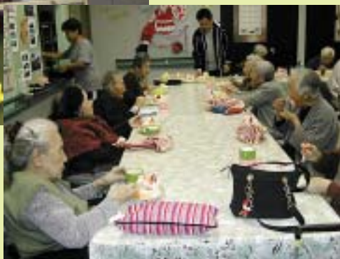
12月24日 クリスマス会