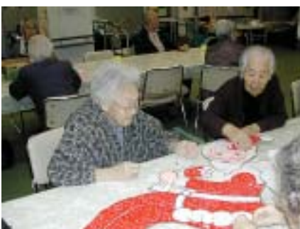
11月 クリスマス飾り作り