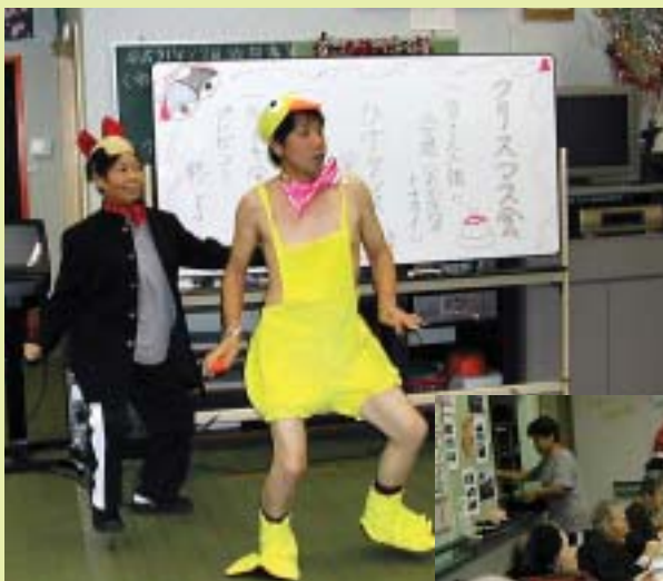
12月23日 クリスマス会