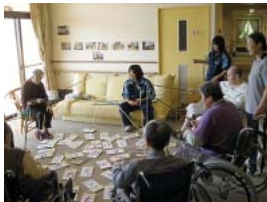
10月 尾鷲中学福祉共生体験