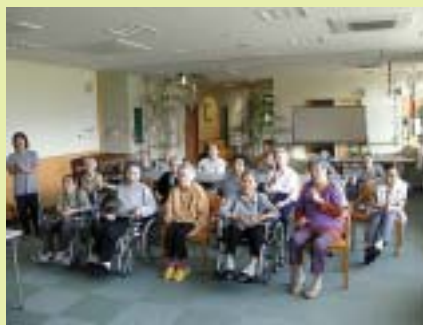
7月 7日 七夕