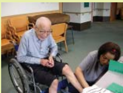
6月21日 父の日の マッサージ