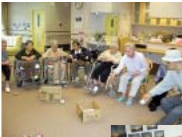
6月 あかつきクラブ