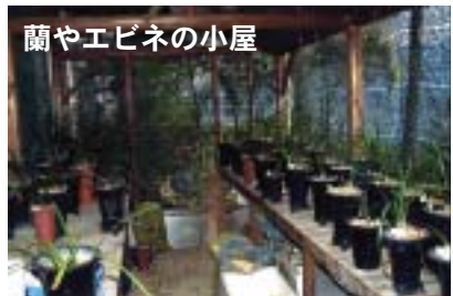
蘭やエビネの小屋