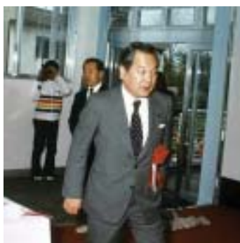
■斎藤十朗氏 (当時参議院議員)