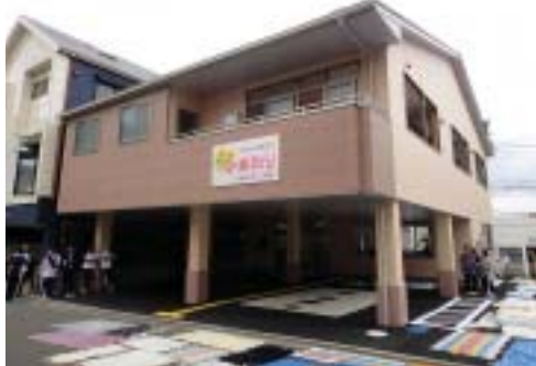
新築したデイサービスセンターひまわり