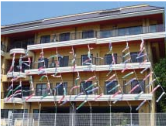
■あかつきの鯉のぼり