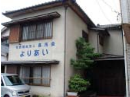
■小規模多機能型居宅 よりあい