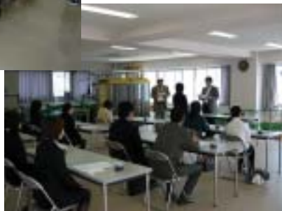
■新入職員への辞令交付