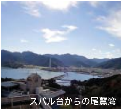
スバル台からの尾鷲湾

社会福祉法人 長茂会 http://www.owasechojuen.or.jp/ 〒519-3601 三重県尾鷲市大字南浦4587-4 TEL. 0597 (22) 8100 FAX. 0597 (22) 2022