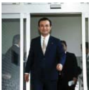
■野呂昭彦氏 (当時衆議院議員)