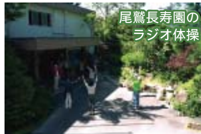
尾鷲長寿園の ラジオ体操