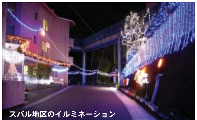
スバル地区のイルミネーション