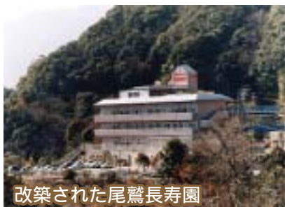
改築された尾鷲長寿園