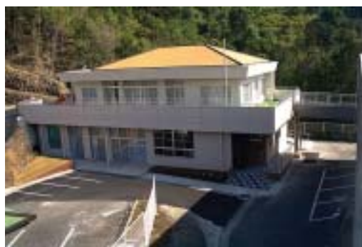
■デイサービスセンター

昭和63年4月 特別養護老人ホーム「スバル台修路（現：スバル台）」開園 昭和63年4月 ショートステイ「スバル台修路（現：スバル台）」事業開始 平成元年2月 市有形文化財「岩船地蔵」を敷地内へ移転 平成元年2月 「供養堂」建立 平成元年2月 「尾鷲長寿園診療所（現：長茂会診療所）」開設 平成3年4月 「デイサービスセンター スバル台」開設