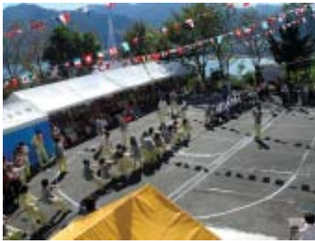
■尾鷲長寿園での運動会