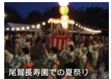
尾鷲長寿園での夏祭り