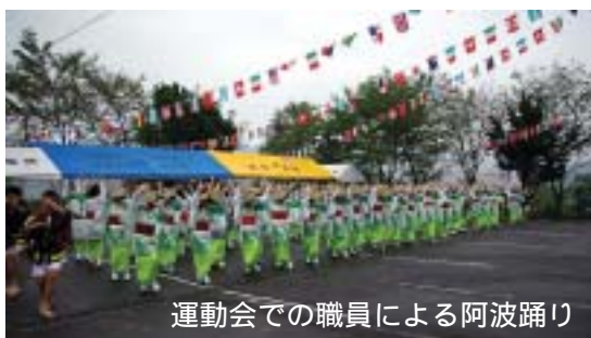
運動会での職員による阿波踊り