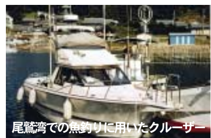
尾鷲湾での魚釣りに用いたクルーザー