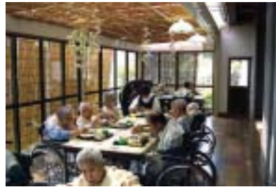
■スバル台のサンルーム食堂