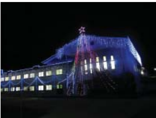
■聖光園のイルミネーション