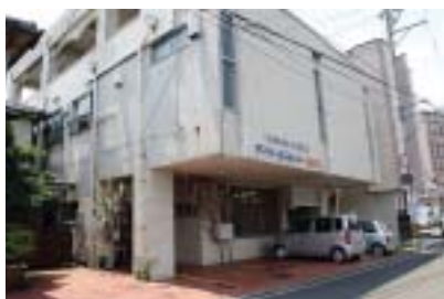
■デイサービスセンターひまわり