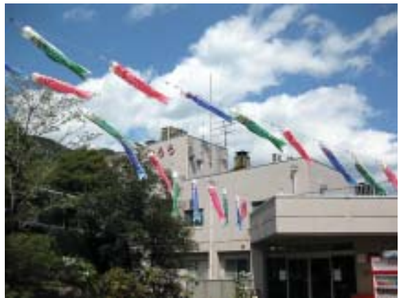
■きららの鯉のぼり