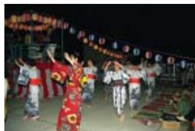
■きらら屋上での夏祭り