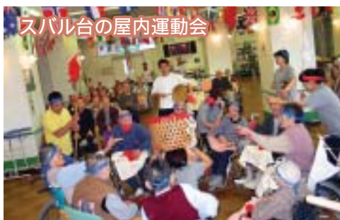
スバル台の屋内運動会