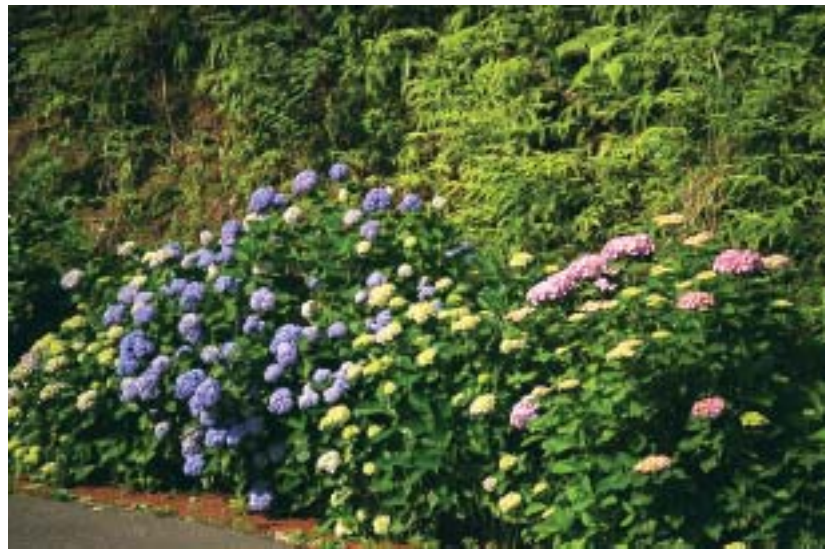
■高浜先生手入れのスバル地区紫陽花