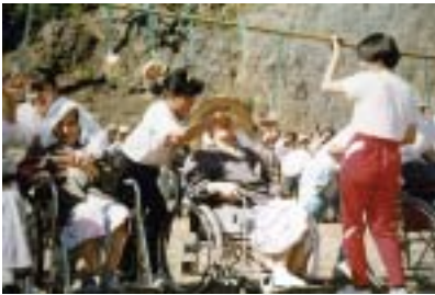
■スバル台の運動会