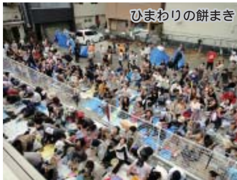
ひまわりの餅まき