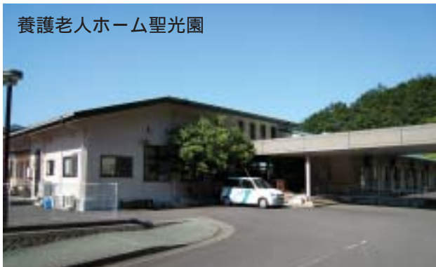
養護老人ホーム聖光園