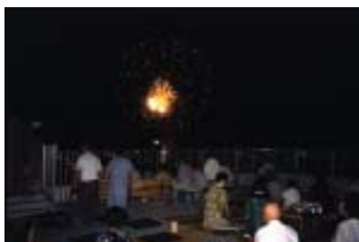
■きらら屋上からの尾鷲花火