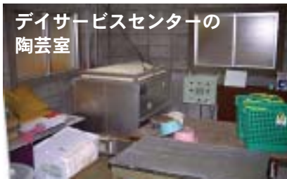
デイサービスセンターの 陶芸室