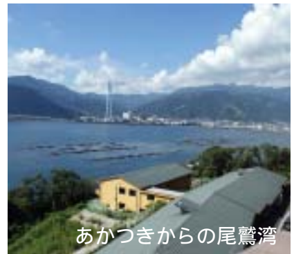
あかつきからの尾鷲湾