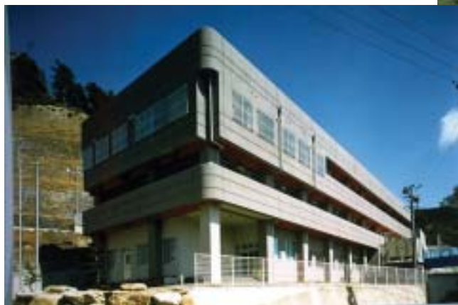
■特別養護老人ホーム