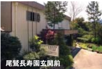
尾鷲長寿園玄関前