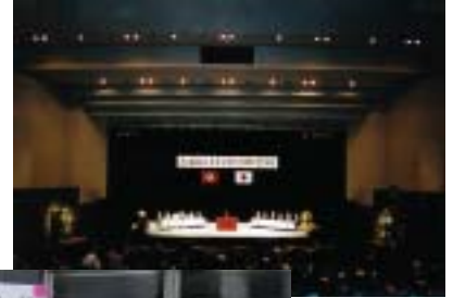
■三十周年記念式典 (平成18年5月。 せぎやまホール)