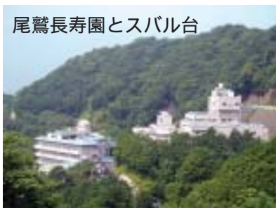
尾鷲長寿園とスバル台