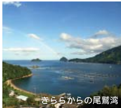
きららからの尾鷲湾