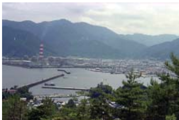
■尾鷲長寿園から望む当時の尾鷲港

昭和51年8月 社会福祉法人「尾鷲長寿園（現：長茂会）」創立 昭和52年6月 軽費老人ホーム「尾鷲長寿園」開園 三重県では初めての軽費老人ホームとなる「尾鷲長寿園」を開園し、長茂会の福祉事業がスタートいたしました。