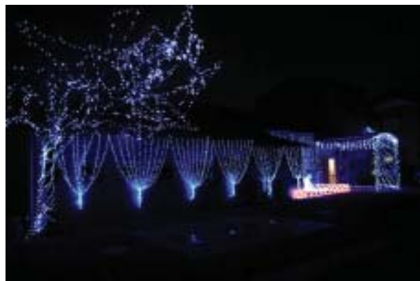
■道のイルミネーション

平成24年4月予定 グループホーム「どんぐり」、ショートステイ「ころころ」を馬瀬に開設 紀北町海山区馬瀬に、グループホームとショートステイを開設いたします。