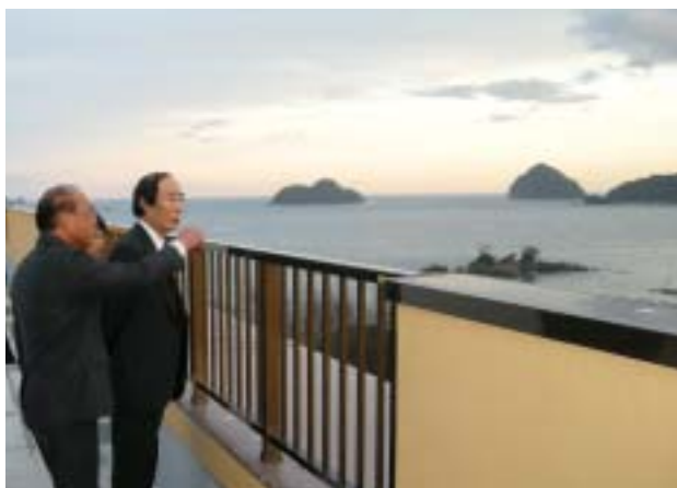
■あかつき屋上での坂口カ氏（衆議院議員）