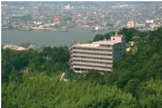
■ケアハウスきらら