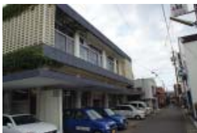
■在宅介護支援センター & ホームヘルプサービス