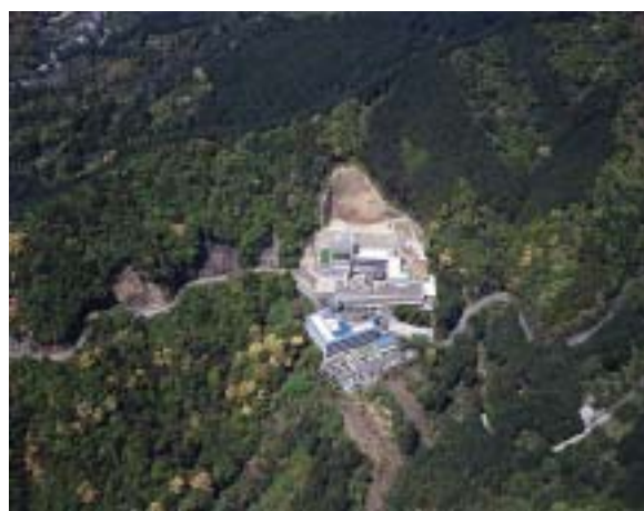
■スバル地区上空からの写真

平成8年1月 軽費老人ホーム「尾鷲長寿園」火災 平成8年12月 軽費老人ホーム「尾鷲長寿園」復旧 平成9年2月 岩船地藏堂「鐘」建立 平成9年2月 新ゲートボール場完成 平成9年3月 特別養護老人ホーム「スバル台修路（現：スバル台）」増設 平成9年3月 ショートステイ「スバル台修路（現：スバル台）」増設 特別養護老人ホーム増設工事中の平成8年1月3日、最初の施設である軽費老人ホームから火災を発生させてしまいました。人身被害こそありませんでしたが、ご利用者をはじめ、関係各位へは、多大な不安と損害をおかけしてしまいました。