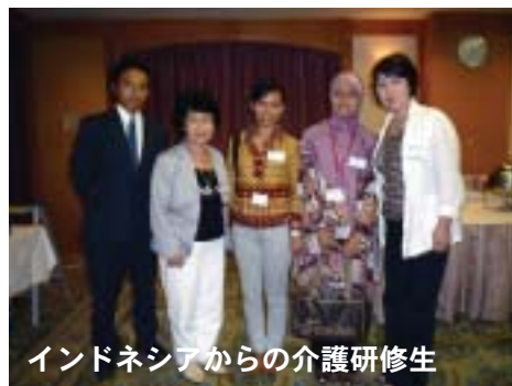
インドネシアからの介護研修生