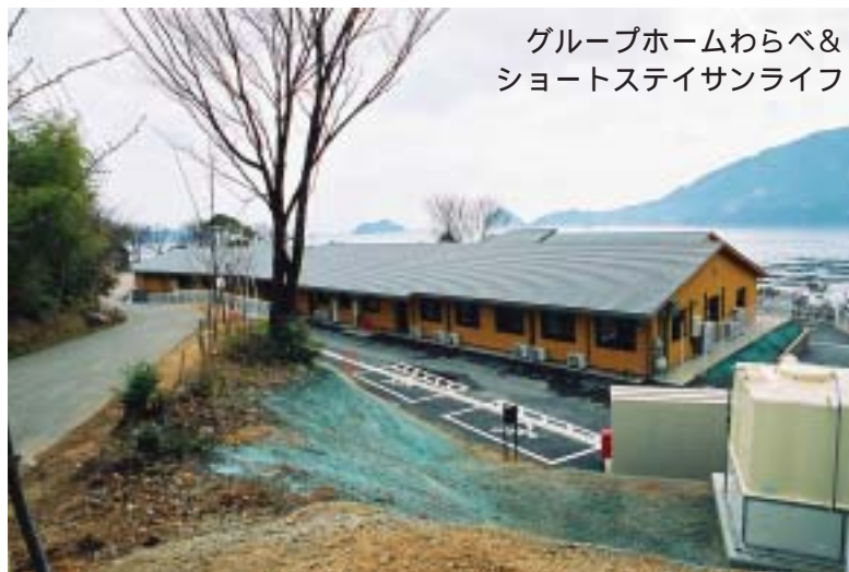
■わらべ&サンライフの餅まき