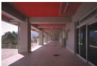
■在宅介護支援センターは、きららの最下階にありました