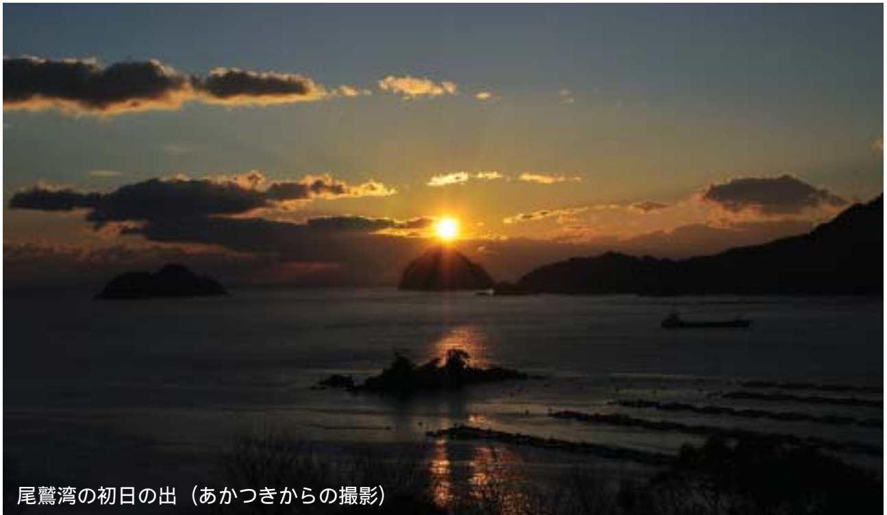
尾鷲湾の初日の出（あかつきからの撮影）