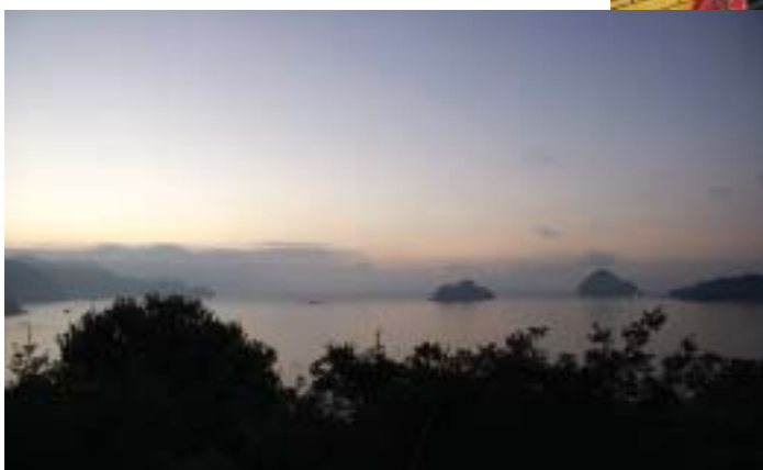
■猪ノ鼻水平道の夜明け