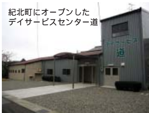
紀北町にオープンした デイサービスセンター道