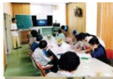
■ひまわり内での活動風景