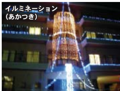
イルミネーション (あかつき)