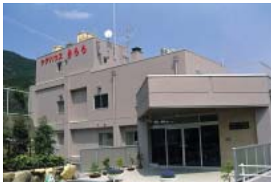
■きららの玄関は5階にあります