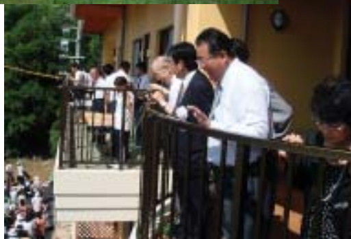
■あかつきの餅まき