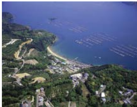
■きらら地区上空からの写真

平成13年4月 在宅介護支援センター「たんぼぼ」開設 平成13年4月 ホームヘルプサービス「尾鷲長寿園」移転 平成14年6月 デイサービスセンター「ひまわり」開設 軽費老人ホームの改築や、特別養護老人ホームの増築がなった後は、尾鷲市中心部にホームヘルプサービスを移転、また、在宅介護支援センター（現：居宅介護支援事業所）や、ふたつめとなるデイサービスセンターを開設し、在宅サービスの拡充をすすめました。