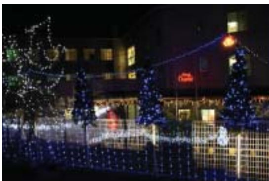
■スバル台玄関前からの尾鷲長寿園玄関付近